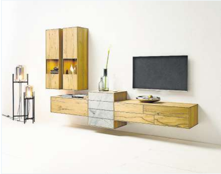
Neu bei Möbel Schaller: Schöne Echtholz-Möbel der Firma Anrei.