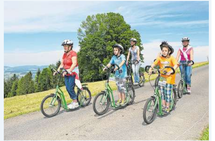
Trottiplausch ist für Jung und Alt ein rasanter Spass.