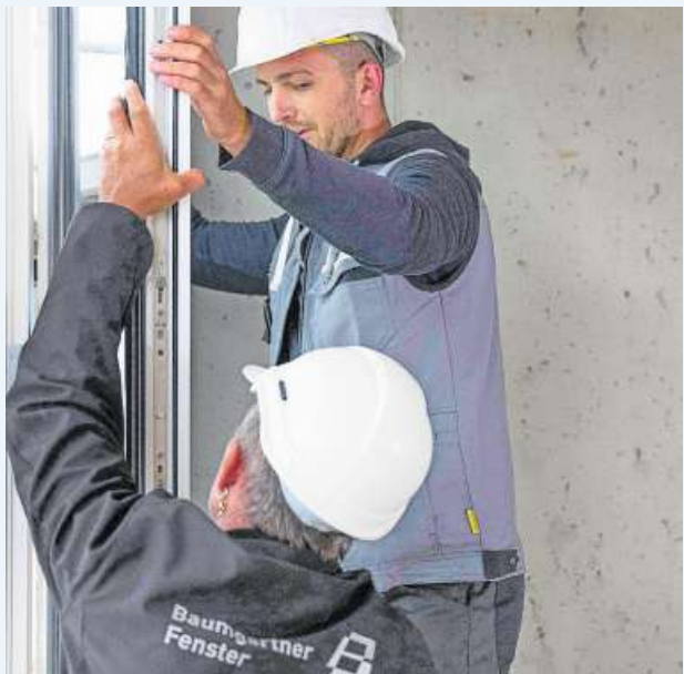
Feineinstellung des Baumgartner-Produktes Saphir Integral in einem Neubau.

Baumgartner-Produkte Saphir Integral 67/67 Entwicklung 2020-1 und Saphir Integral 67/67 Entwicklung 2020-2. «Unser hoher Innovationsgrad macht sich bezahlt», ist Stefan Baumgartner überzeugt. Die G. Baumgartner AG ist die modernste Fensterfabrik der Schweiz und wohl auch Europas. Um an der Spitze der technologischen Entwicklung zu bleiben und auch weiterhin umweltfreundlichste Fenster herzustellen, soll nun in das Innovationsprojekt Gottfried Baumgartner investiert werden. Die dafür notwendige Zonenplananpassung und der entsprechende Bebauungsplan werden den Stimmbürgerinnen und Stimmbürgern der Gemeinde Cham am 29. November zur Genehmigung unterbreitet. pd