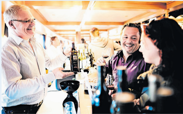
20 Winzer aus der Schweiz präsentieren ihre wertvollen Tropfen.