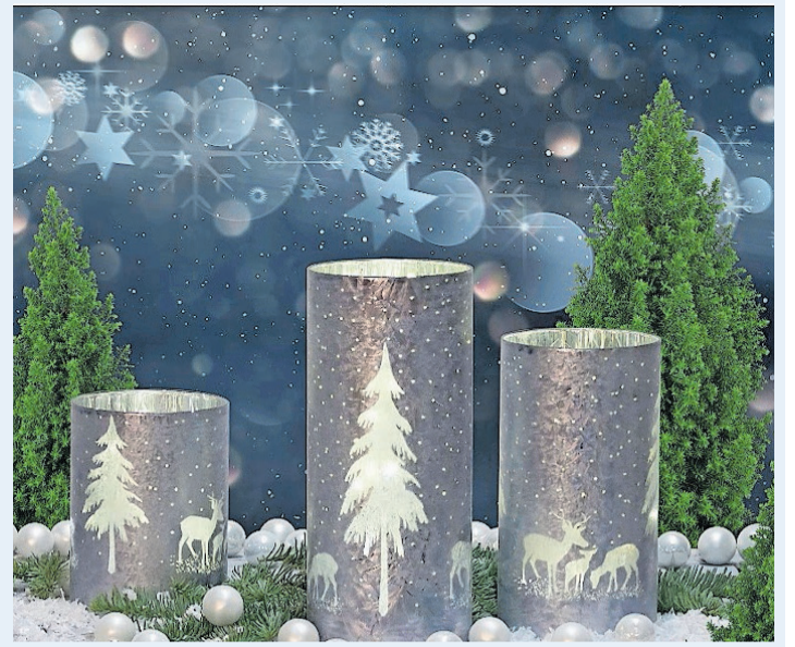
Nordlichter im Advent gibt es an der Weihnachtsausstellung der Gärtnerei Herrmann in Baar zu bestaunen.