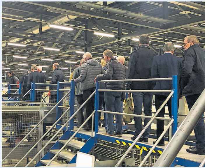
Modern: Mitglieder der FDP des Kantons Zug besuchten die Fensterfabrikation Baumgartner in Hagendorn.

Die Firma G. Baumgartner AG will und kann sich jedoch